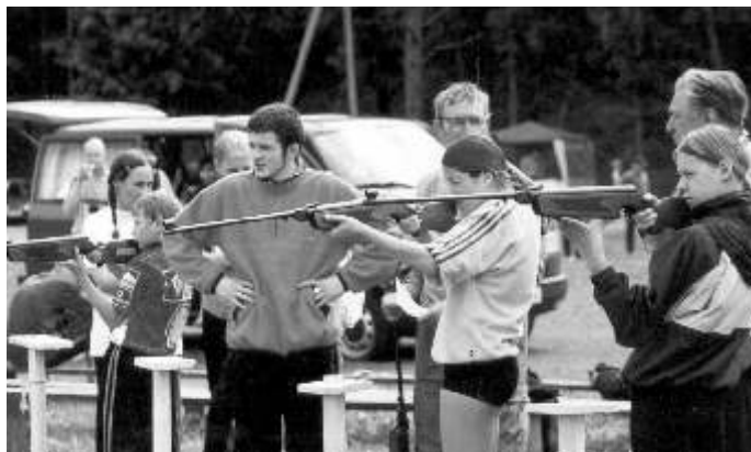
Laskurid välitingimustes täpsust proovimas.