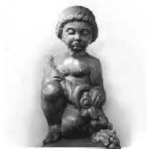
EESTI VABARIIGI KULTUURIMINISTEERIUM