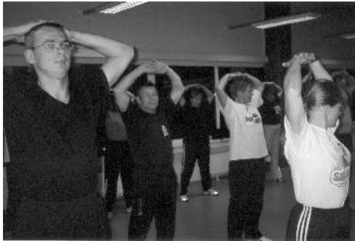
Seminari kavas olid ka praktilised tunnid.

Jääb vaid üks küsimus. Millised teemad, milliste probleemide arutelu on vajalik lülitada järgmise seminar-õppuse programmi?